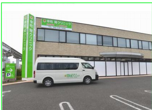
送迎バスあります

■多摩モノレールおよび西武拝島線の場合 玉川上水駅下車し、芋窪街道を砂川七番に向かい、約7分程歩いて頂くと右手にあります。