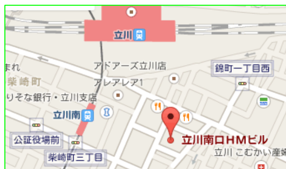
立川駅南口より徒歩2分