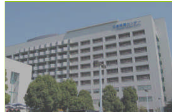
災害医療センター

当院は今後もこうした国の進める制度に積極的に取り組み、地域医療の充実に貢献していけるよう努力いたしますので何卒ご理解・ご協力頂けますようお願い申し上げます。